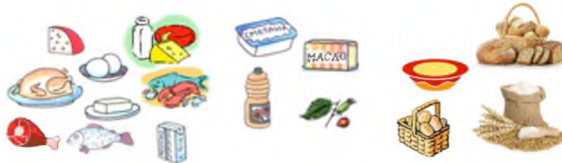
Рис.2 Какие вещества содержат продукты ?