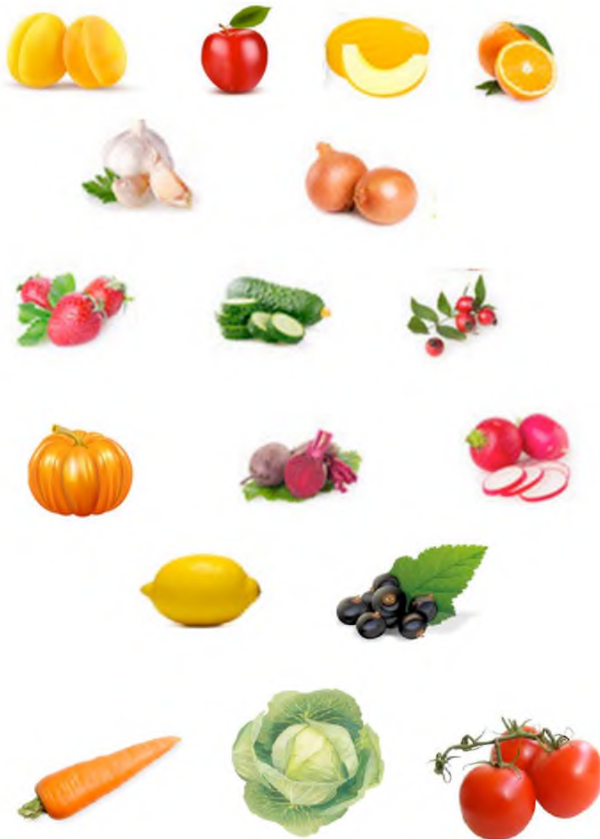
Рис.1 Какие витамины содержат овощи и фрукты?