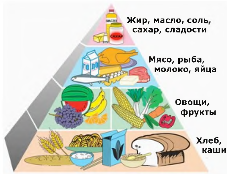
Рис.1 Пирамида питания