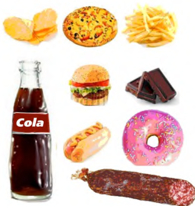
Рис.1 Вредные продукты