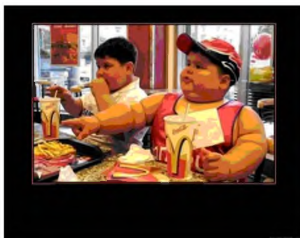
Рис.2 Ребенок, который питается гамбургерами.