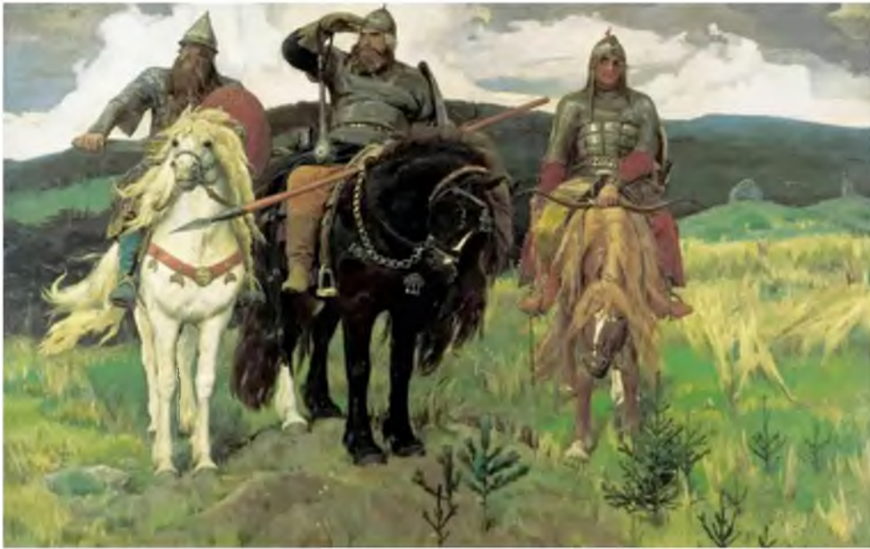
Рис.1 Репродукция картины В.Васнецова «Богатыри».