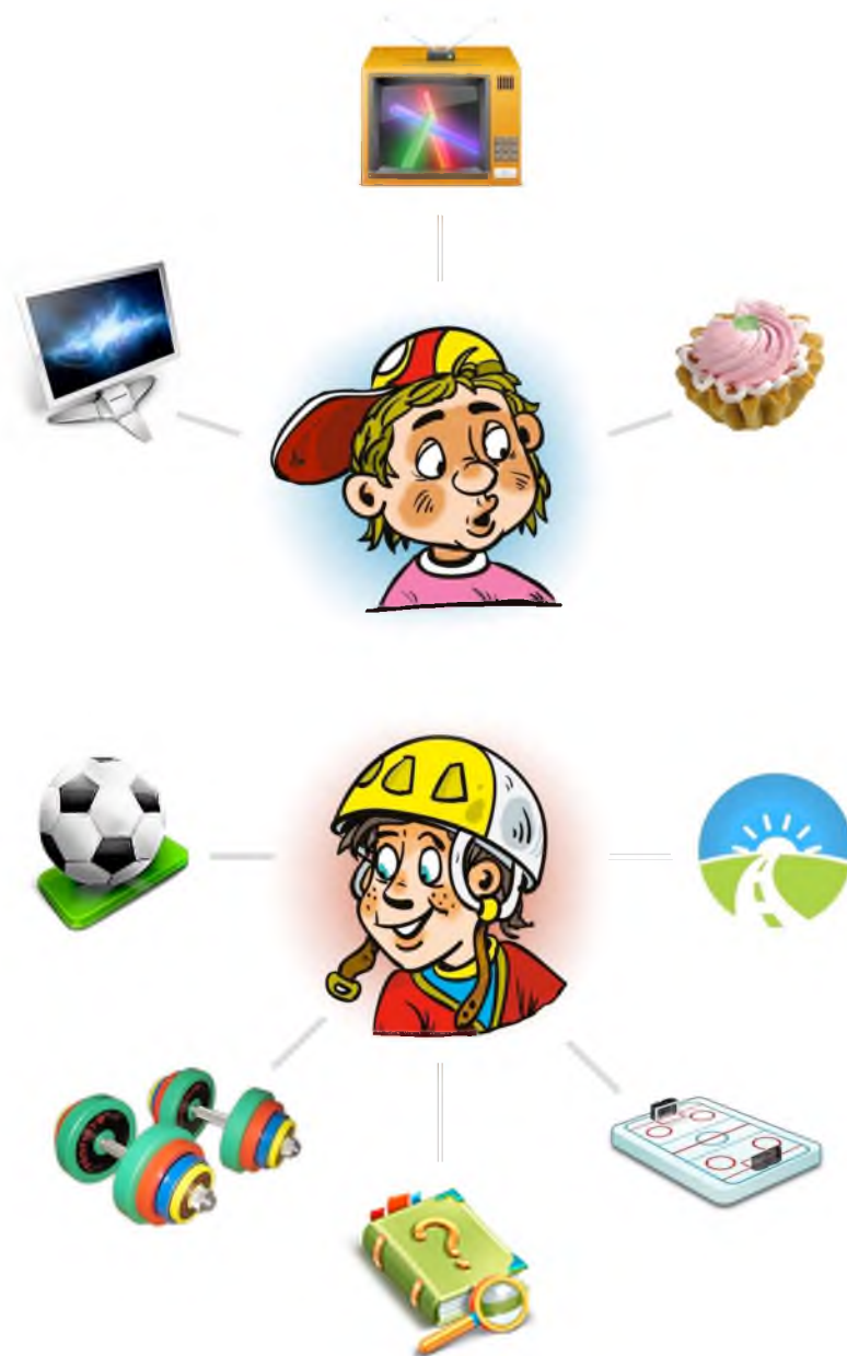
Рис.1 Что успели сделать за день Коля и Макс ?