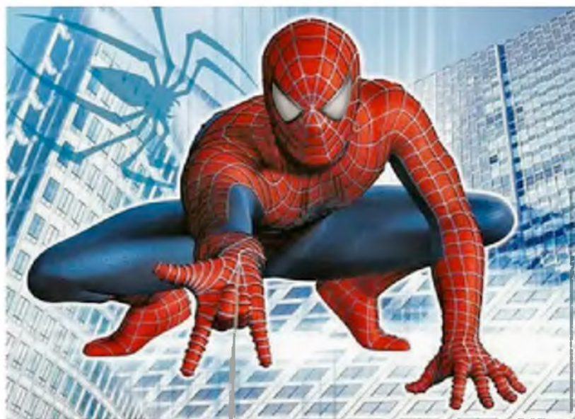
Рис.1 Человек паук